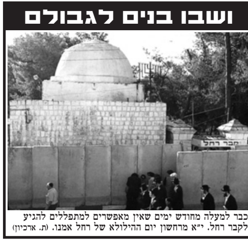
כבר למעלה מחודש ימים שאין מאפשרים למתפללים להגיע לקבר רחל. י"א מרחשון יום ההילולא של רחל אמנו. (ת. ארכיון)

לעת-עתה זו מחאת יחיד, אולי סנונית ראשונה, אך יש בה כדי להזכיר לכולנו את הוראת הרבי שליט"א מלך המשיח, על חובת המחאה המוטלת על כל אחד ואחד מאתנו. וכמובן, יחד עם החובה והזכות הנפלאה להפיץ את בשורת הגאולה והגואל: "הנה הנה זה - מלך המשיח - בא".