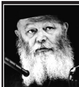
(מוצאי-שבת-קודש פרשת וישב ה'תש"מ)

בנוסף ללימוד היומי בחת"ת (חומש, תהילים, תנאים) ישנה סגולה בהחזקת ספרים קדושים אלו בכל מקום ואף ברכב