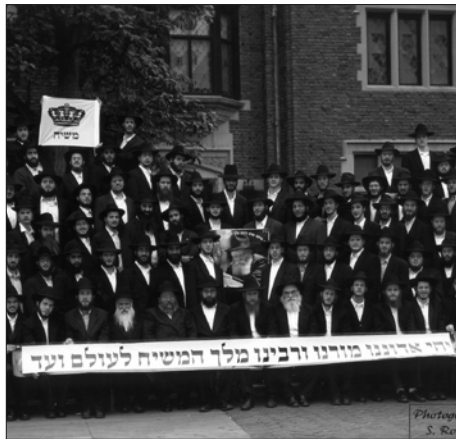
תמונת המחזור של "קבוצה" תש"ס

פרק מיוחד בשנת ה"קבוצה" הוא נושא ה"מבצעים". לכל תלמיד איזור מסויים ברחבי העיר ניו-יורק אותו הוא מאמץ בפעילותו בערבי שבתות וחג. פעילות הכוללת הנחת תפילין, נרות שבת קודש, חלוקת חומר הסברה, הדלקת נרות החנוכה וחלוקת מצה שמורה לקראת פסח וכו'. עבור יהודים רבים בעיר הגדולה, זו חוליית הקשר היחידה עם זהותם היהודית, עליה הם אינם מוכנים לוותר, עד להתגלות המלאה של הרבי שליט"א מלך המשיח בקרוב ממש.