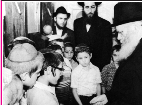
הרבי שליט"א מלך המשיח תורם לצדקה. לחנך לצדקה.