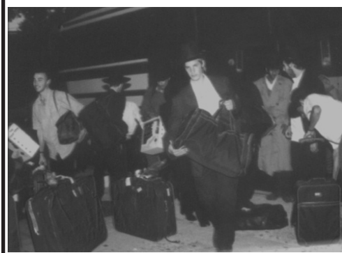
מרחבי הארץ והעולם. אורחים מגיעים אל הרבי שליט"א מליובאוויטש מלך המשיח ב-"770" שבניו יורק לחגים.