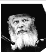
(לרן אדליסט, כסלו תנש"א)

יחד עם הלימוד היומי בשיעורי החת"ת (חומש, תהילים, תנאי) קיימת סגולה בהחזקת ספרים