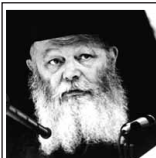
(כ' מנחם-אב ה'תשל"ח)

יחד עם הלימוד היומי בשיעורי החת"ת (חומש, תהילים, תנאי) קיימת סגולה בהחזקת ספרים