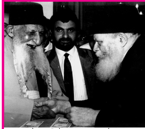
הצדיק המקובל הרב יצחק כדורי שליט"א מקבל את ברכת הרבי שליט"א מליובאוויטש מלך המשיח. סיון ה'תש"נ