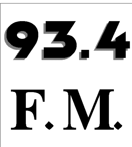
לשדר עד ההתגלות

התגובות הרבות החמות מלמדות על החשיבות הרבה שהמאזינים מייחסים לתחנה, תכניה וליעדה העיקרי - הפצת בשורת הגאולה ושידור התגלות הרבי שליט"א מלך המשיח. שיפור מערכת הקליטה והשידורים והוספת תוכניות הינם ממשימותיה הראשוניות של התחנה. לשם כך זקוקה התחנה לעזרת ציבור המאזינים והקוראים כאחד, בדחיפות רבה, וזכות הרבים תלויה בכל אחד ואחת ותורמתם החשובה. ניתן להקדיש תוכניות לזכות קרובים וידידים. הטלפון לתרומות, ולהקדשות: 03-657-0895.