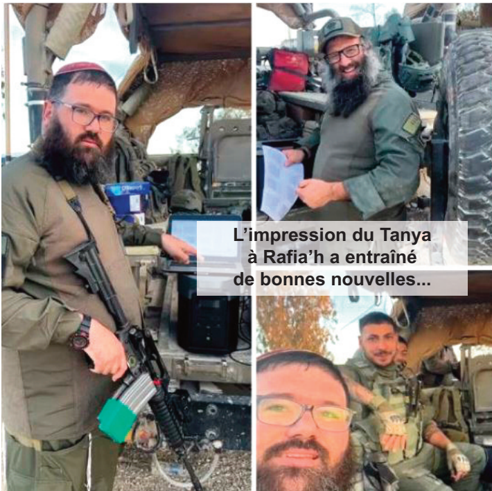
L'impression du Tanya à Rafia'h a entraîné de bonnes nouvelles...

La libération des otages est, à chaque fois, notre libération à nous, à tous. Chaque jour nous rapproche un peu plus du dévoilement final et plus on donnera de la place à cette joie de servir D.ieu. Et plus la largesse s'installera dans notre vie. Plus la joie et l'unité s'installera dans le Peuple Juif, et plus les bonnes nouvelles et les délivrances se feront jour chez nous, pendant que le Troisième Temple descendra du ciel juste maintenant.