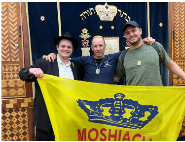
מצטלמים יחד ב-770

בסיום הסיור, הצעתי להם, כפי שבדרך כלל מציעים לכל אדם שמגיע ל-770, לכתוב לרבי שליט"א מלך המשיח באמצעות האגרות קודש ולקבל את ברכתו בכל המצטרך