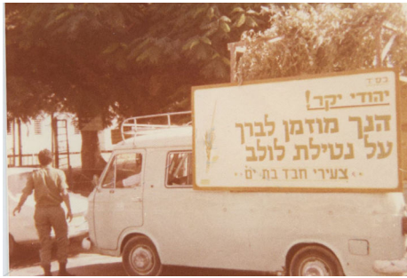
מזראות הפעילות באותן שנים

גם מאפיית המצות הראשונה שיועדה ללמד את הילדים באפיית המצות ובדיני החג, נפתחה לראשונה בארץ ישראל, דווקא בבת ים. היה זה הרב זמרוני ציק, שבחזונו הביא עוד ועוד רעיונות, כל זה מתוך התבטלות מוחלטת לרבי שליט"א מלך המשיח, ורצון פנימי לקיום כל הוראותיו.