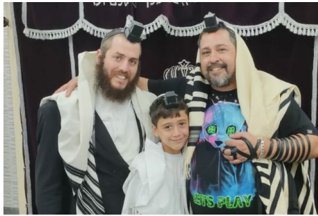
עם אחד מהנערים בבר המצווה

"אחת מבעלות העסקים בשכונה שאלה אותי באחד הימים אם אפשר לבקש ברכה לחתונה. התברר שמדובר בהצעה שכבר עלתה, ולאחר מספר בדיקות, הם חשבו אכן להקים את ביתם יחד, וכעת ביקשה את ברכת הרבי שליט"א מלך המשיח. אכן, לאחר הסבר קצר, היא כתבה, אך הופתעתי לראות שהתשובה אמרה בפירוש שלא להתחתן וכי יש לדחות את החתונה לפחות בשנתיים. גם היא הופתעה, אך לאחר שבועיים היא אמרה שב"ה בזכות שהקשיבה לעצה שקיבלה, היא גילתה שאכן החתונה עם אותו אחד לא היתה מתאימה לה כלל". אלו הן רק מקצת מהפעולות שנעשות בבית חב"ד לקבלת פני הרבי שליט"א מלך המשיח. לפרטים: 053-277-0441.